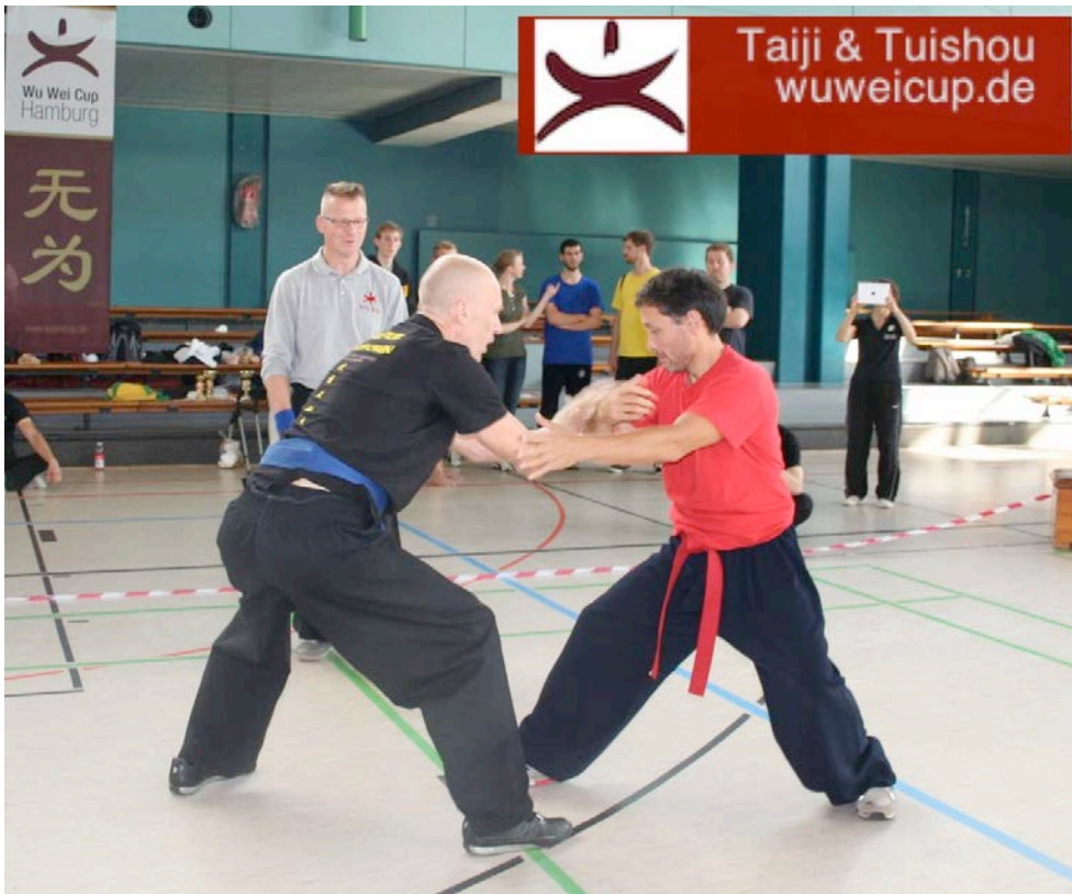
Wettkämpfe bieten die Gelegenheit, die eigenen Fähigkeiten in sehr intensiver Atmosphäre mit VertreterInnen anderer Schulen und Stilrichtungen auszuprobieren.